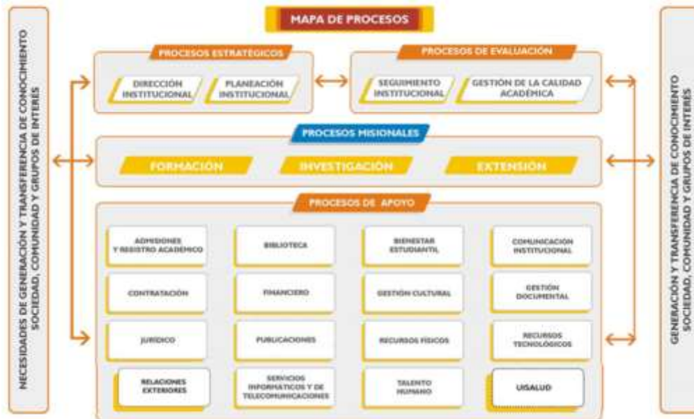
Figura 2. Mapa de Procesos

La Universidad Industrial de Santander está organizada por procesos: de apoyo, misionales, estratégicos y de evaluación.