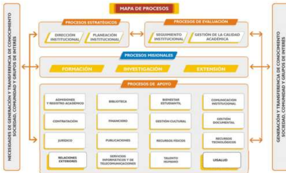
Figura 2. Mapa de Procesos

La Universidad Industrial de Santander está organizada por procesos: de apoyo, misionales, estratégicos y de evaluación.