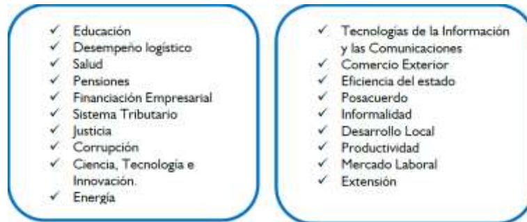
Figura 4. retos nacionales y regionales

Frente a los retos a nivel nacional y/o regional la Universidad identifica los siguientes, los cuales se detallan en el documento base para la actualización del Proyecto Institucional y construcción del Plan de Desarrollo Institucional 2019-2030.