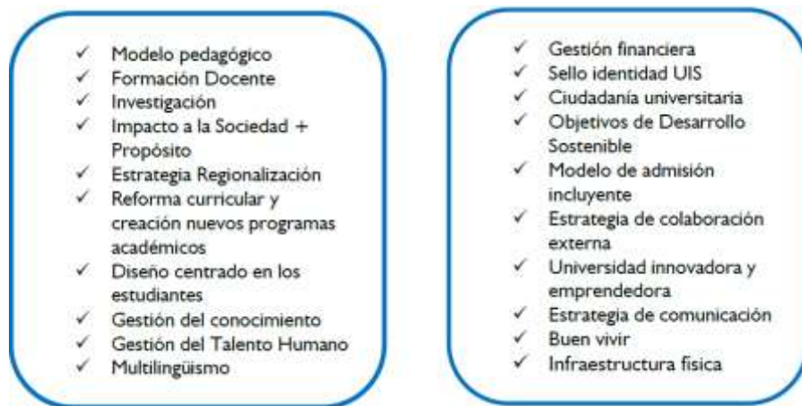
Figura 3. retos institucionales

Estas dimensiones están alineadas con las principales tendencias en educación superior en el contexto global, regional y nacional y hacen referencia a los retos que tiene la Universidad y su rol dentro del contexto actual.