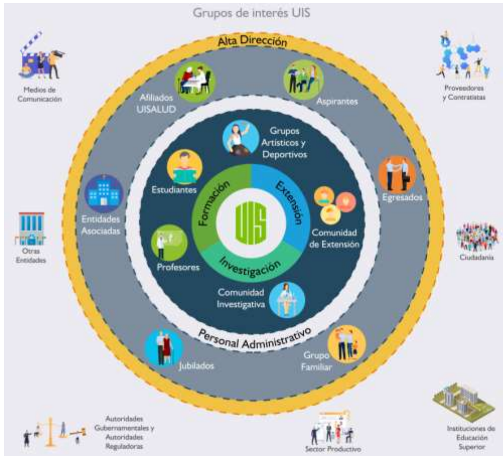
Figura 5. Grupos de Interés UIS

Zona 5: Representa el colectivo de grupos externos con los cuales la Universidad se relaciona siendo “usuario” o “abastecedor”.