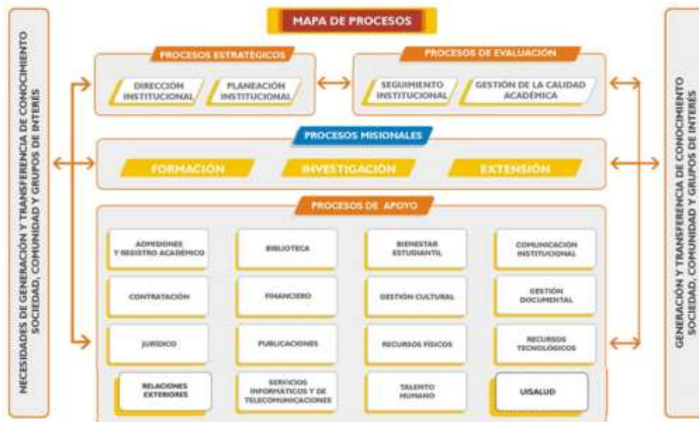
Figura 2. Mapa de Procesos

La Universidad Industrial de Santander está organizada por procesos: de apoyo, misionales, estratégicos y de evaluación.